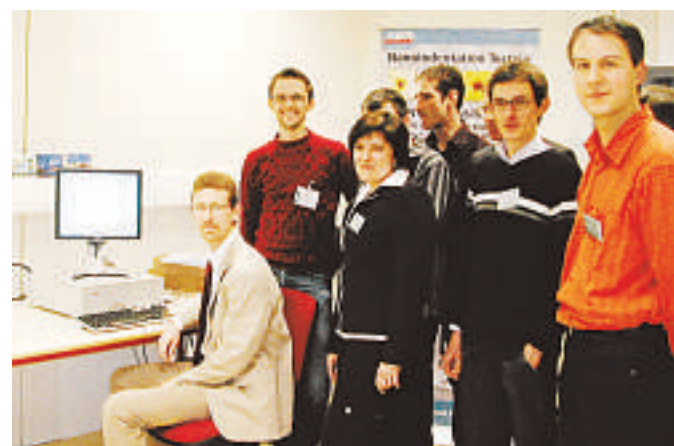
Chercheurs de l'UHA et de CSM Instruments réalisent des essais sur les échantillons apportés par les entreprises.

■ L'équipe mécanique, matériaux, procédés de fabrication (MMPF) de l'Université de Haute-Alsace a accueilli mercredi 11 mars, dans ses locaux de l'IUT de Mulhouse, un workshop organisé par l'entreprise CSM Instruments, leader mondial des mesures mécaniques de surface. Utilisant ses équipements depuis 2005, l'équipe de recherche a accepté d'accueillir cette journée organisée par l'entreprise.