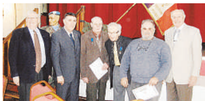
Les trois médaillés entourés des personnalités.